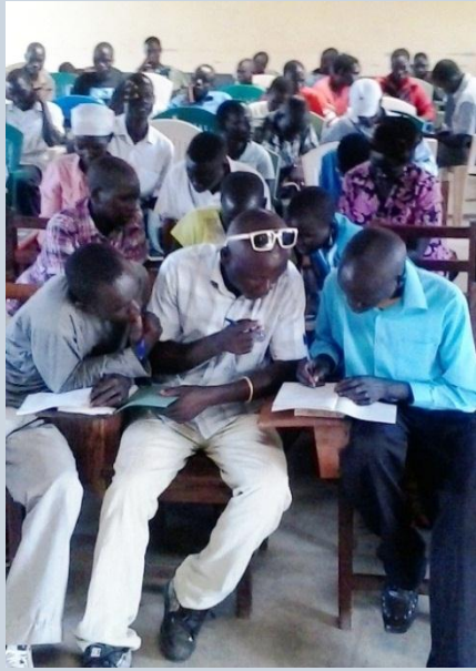
Zondagsschoolleiders bezig met een opdracht