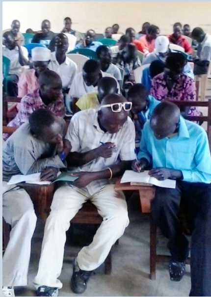
Zondagsschoolleiders bezig met een opdracht