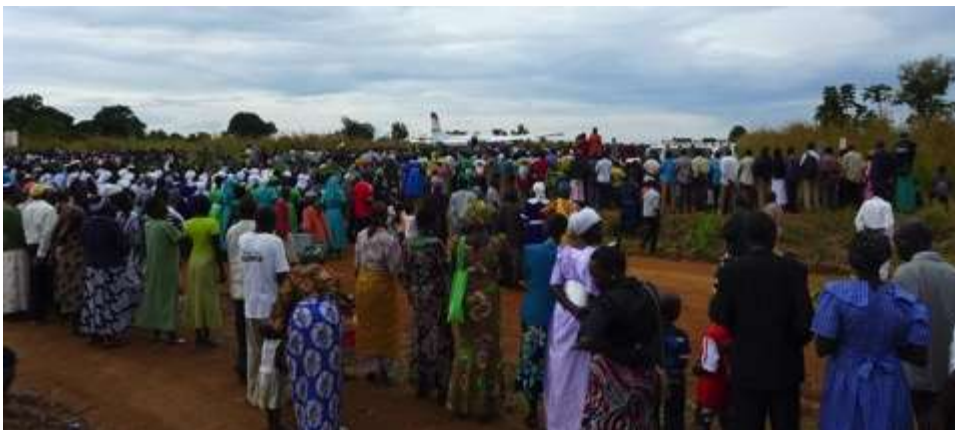
Er waren heel wat mensen op de been om de bisschoppen te verwelkomen die met drie MAF-vliegtuigjes in Kajo-Keji arriveerden.